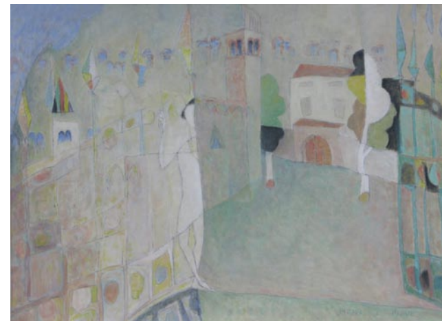
Seraval e Pieve, olio su faesite, cm. 60x80, 1990.

Nonostante la sua naturale ritrosia, ottiene numerosi riconoscimenti, in particolare al Premio "Arrigo Boito" di Polpet (Belluno), dove è presente in quasi tutte le edizioni fra il 1974 ed il 1983, ed al Concorso "La città e il fiore" di Vittorio Veneto.