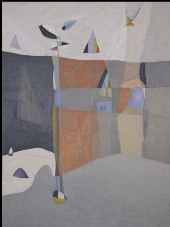
La città è un fiore, olio su tavola, cm. 160x120, 1988.