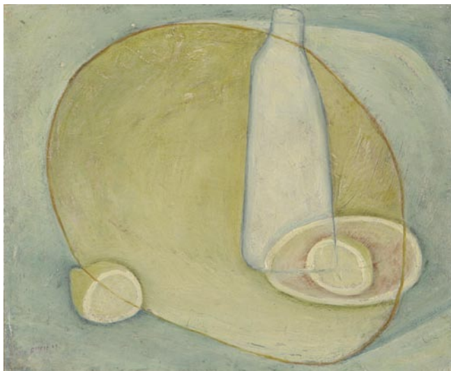
Senza titolo, olio su tavola, cm. 32x39, 1949.