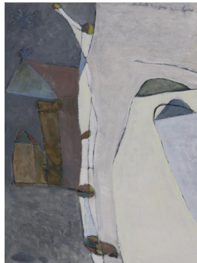
La chiesa di San Giuseppe, olio su faesite, cm. 80x60, 1994.