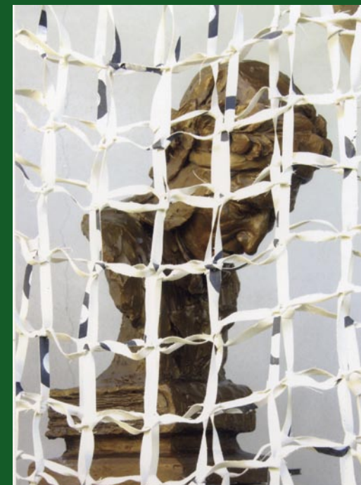
Fernando Garbellotto, Rete frattale , 2008.

Da Garbellotto a Soldera Forme d'arte nella rete del tempo Tappe a ritroso